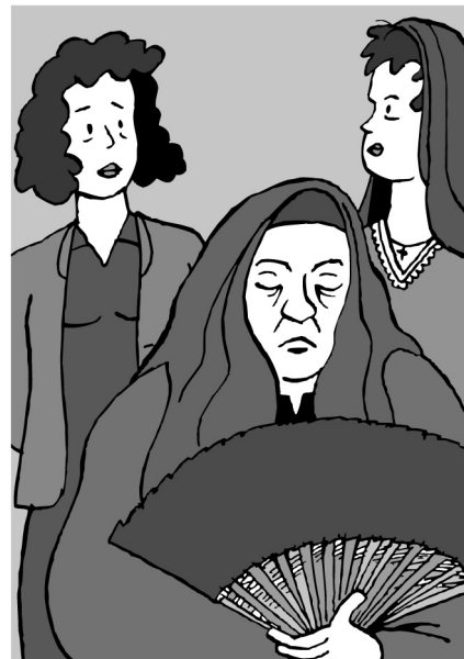
Federico GARCÍA LORCA La casa de Bernarda Alba, Cádiz